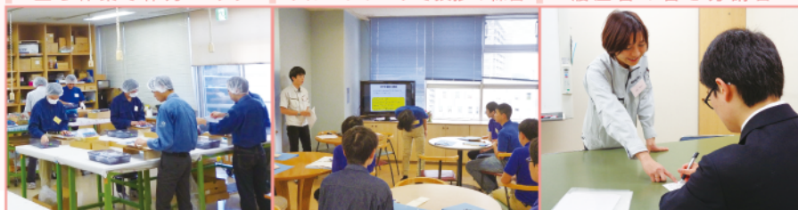
履歴書の書き方講習