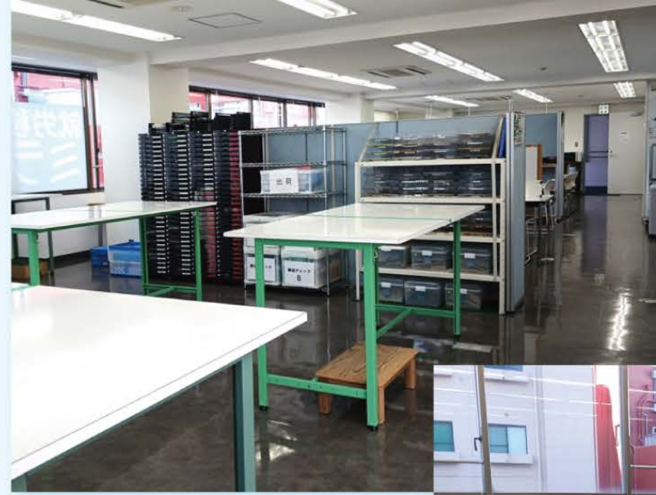
トレーニングルーム