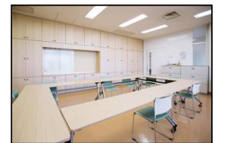
2F ボランティアコーナー (定員 12名)