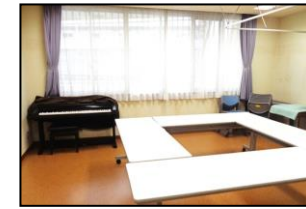
3F 地域ケアルーム (定員 8名)