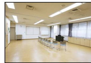
3F 多目的ホール (定員 35名)