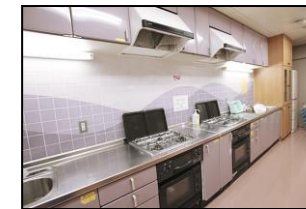
3F 調理室 (定員 3名)