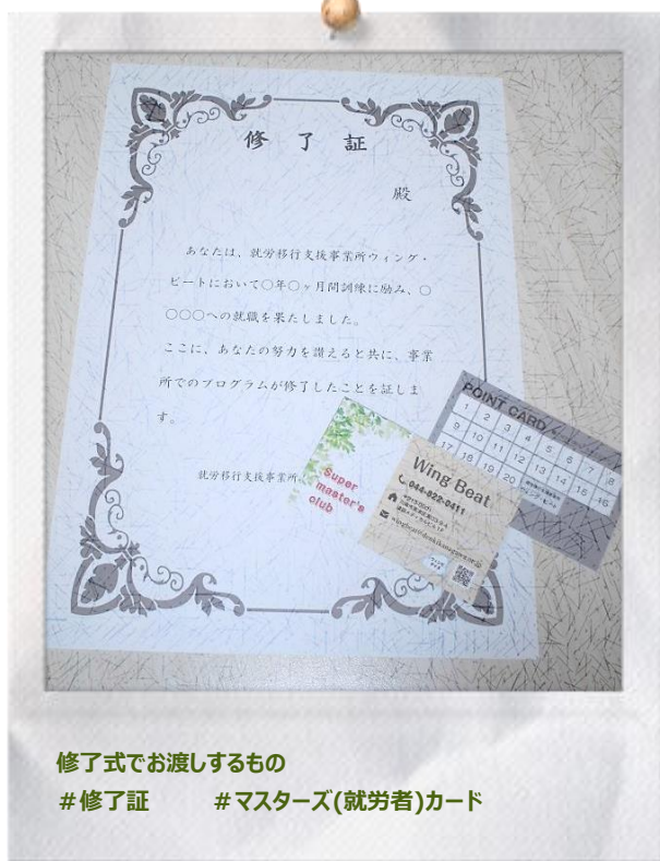
修了式でお渡しするもの #修了証 #マスタース(就労者)カード