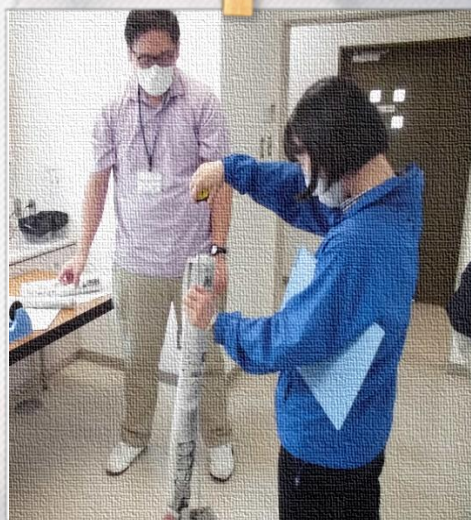
#新聞紙タワーを作ろう！ どうしたら高く繋がれるか、考えながら積んでいきます