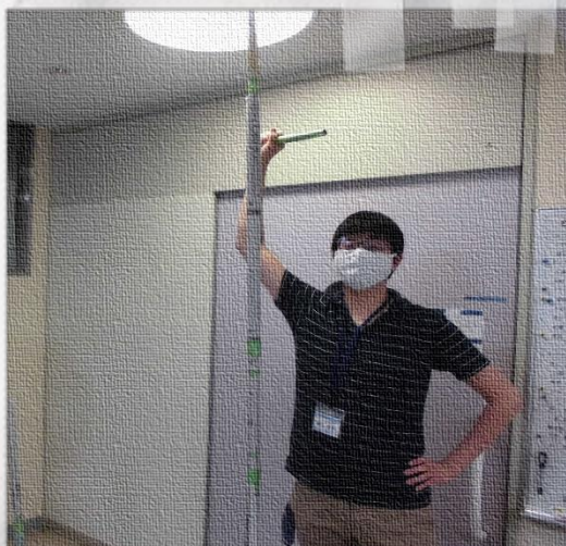
#新聞紙タワーを作ろう！ コミュニケーションプログラムにて実施しました！ 優勝チームの笑顔の一枚です。天井まで到達していました！